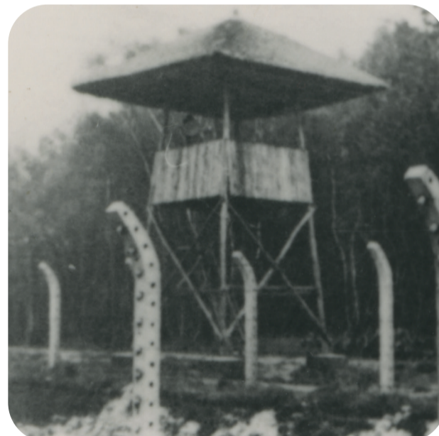
Omheining en wachttoren Kamp Vught.